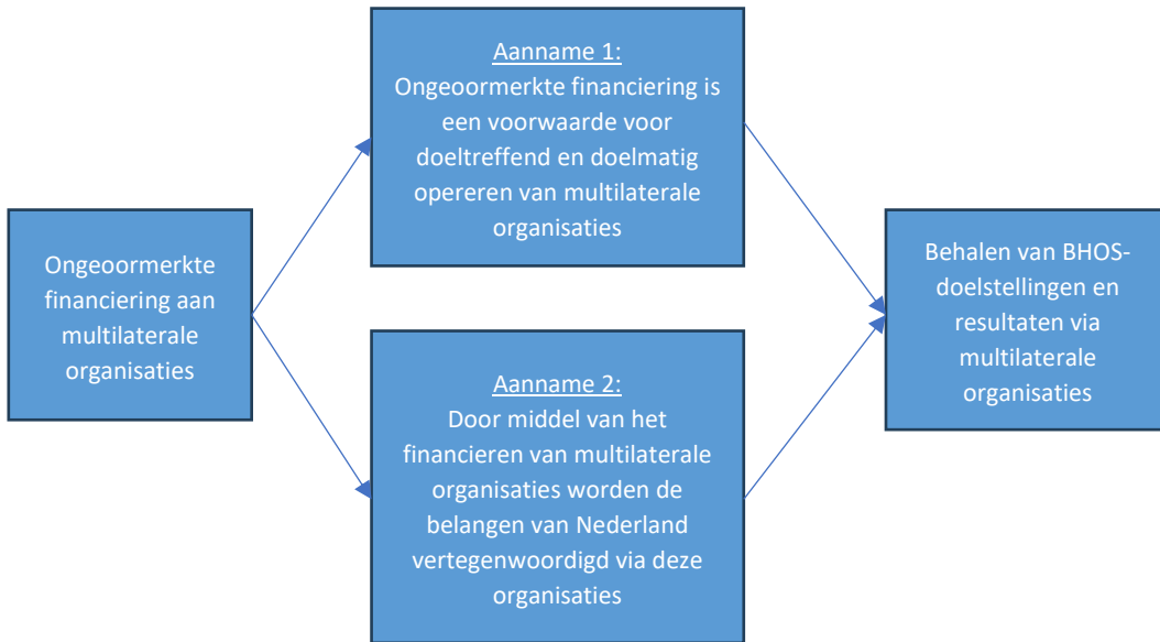
Figuur 1: Versimpeld overzicht doelen en beleidsinzet Nederland onder artikel 5.1

De Nederlandse betrokkenheid bij multilaterale organisaties is grotendeels gebaseerd op de volgende principes: 23