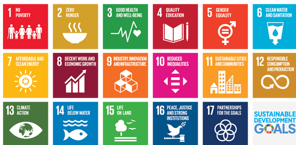
Box 1 De 17 wereldwijde duurzame ontwikkelingsdoelen (SDG's)