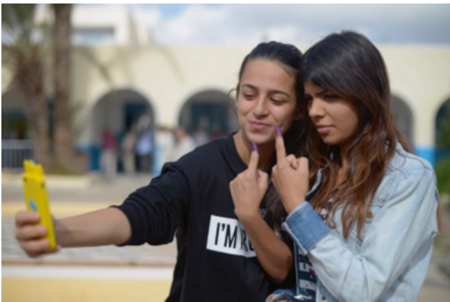
Jonge vrouwen fotograferen zichzelf tijdens de verkiezingen in Tunesië (Hamideddine Bouali, 2014).

IOB onderzocht de Nederlandse bijdrage aan de bevordering van democratische transitie in de Arabische regio voor de periode 2009-2013. Deze evaluatieperiode betreft een tijdvak van twee jaar voorafgaand en twee jaar volgend op de golf van protesten. De gedachte was dat kansen voor democratisering en de ontwikkeling van de rechtsstaat steun verdienen en uiteindelijk de Nederlandse belangen dienen op het gebied van handel, energievoorziening, het tegengaan van illegale migratie en veiligheid.