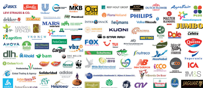
Figuur 1 Logo's van bedrijven en organisaties waarmee IDH rond 2010 samenwerkte

Voor de periode 2008 tot eind 2015 heeft het ministerie van Buitenlandse Zaken 123 miljoen euro aan ontwikkelingshulp beschikbaar gesteld aan IDH. Het ministerie overweegt vervolfinanciering. Dit was de directe aanleiding voor de IOB review. IOB heeft een desk studie gedaan, 70 betrokkenen geïnterviewd en een workshop georganiseerd over de toekomst van ketenverduurzaming.